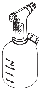
1L EasyPump Art. 11114